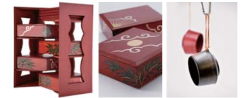
NODATE mug キッチン収納 ガラス・カップ

事務局にてプロのカメラマンにより商品の撮影を行い、著作権とともに写真データをご提供いたします。