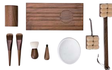
「スーヴェブラッシング・スキン・ケア」 有限会社瑞穂(広島県安芸郡熊野町)

The Wonder 500™の取り組みで、認定商材の海外展開を成功させています!